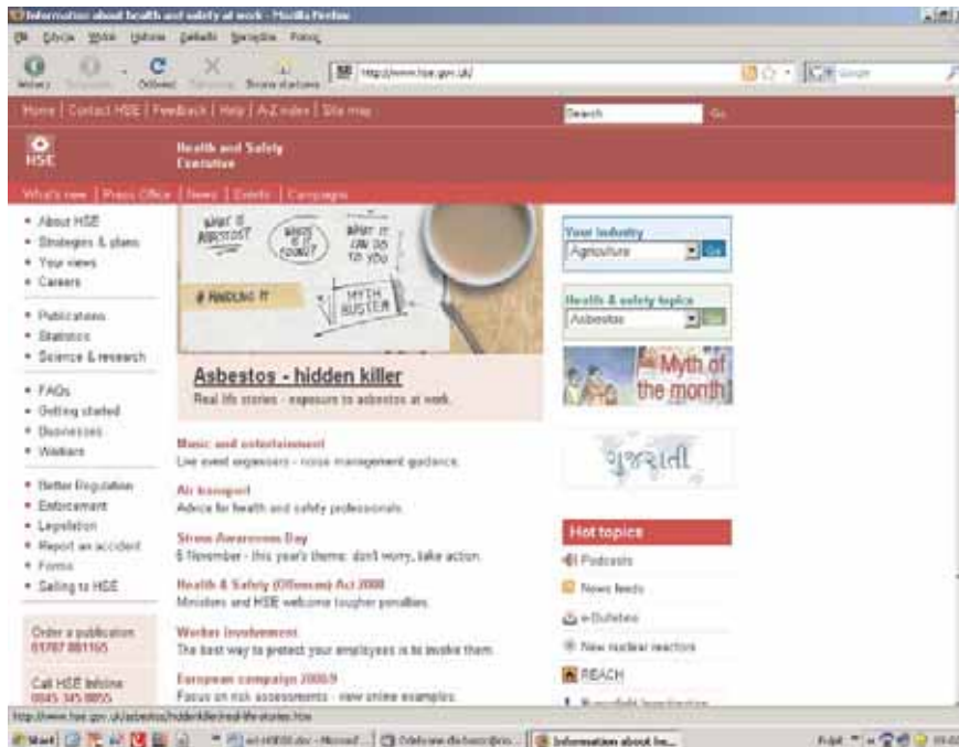
Rys. 1. Strona główna portalu HSE Fig. 1. Main web page of the HSE portal