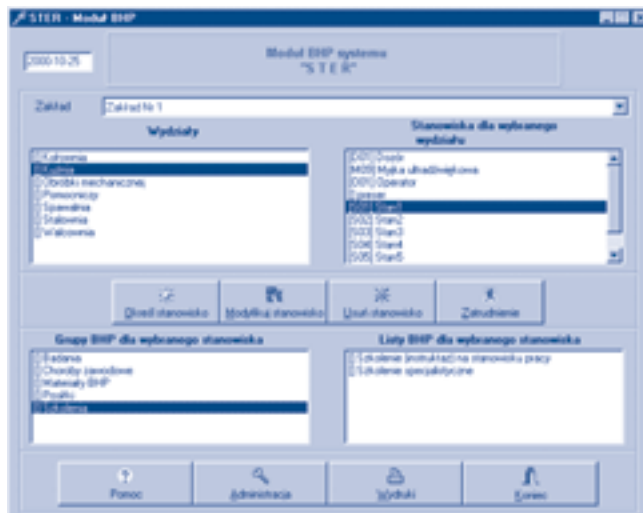
Rys. 4. Winieta modułu STER-BHP

żeń i natężeń czynników szkodliwych dla zdrowia w środowisku pracy (Dz.U. nr 79, poz. 513,1998 r.);