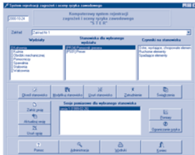
Rys. 1. Winieta modułu RYZYKO

Ocena ryzyka zawodowego na stanowiskach pracy dokonywana jest w module RYZYKO w skali 3-stopniowej (ryzyko małe, średnie lub duże) na podstawie porównania wyników pomiarów stężeń lub natężeń czynników szkodliwych i uciążli-