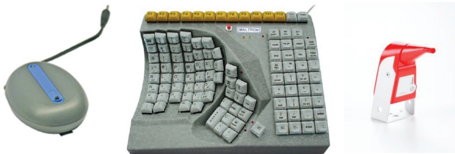
Rys. 2. Przykładowe urządzenia wspomagające pracę z komputerem

Kompleksową informację w zakresie dostosowania środowiska pracy można znaleźć m.in. w następujących instytucjach: